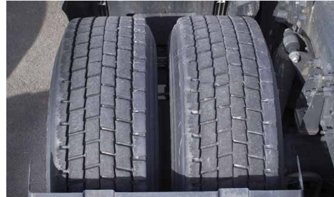
Väh. 50% renkaan alkuperäisestä urasyvyydestä jäljellä