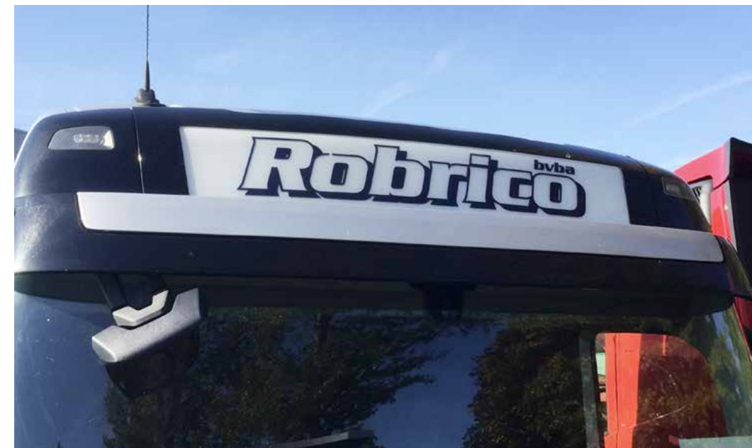
Asiakkaan identifioivat teippaukset auton hytissä ja korissa