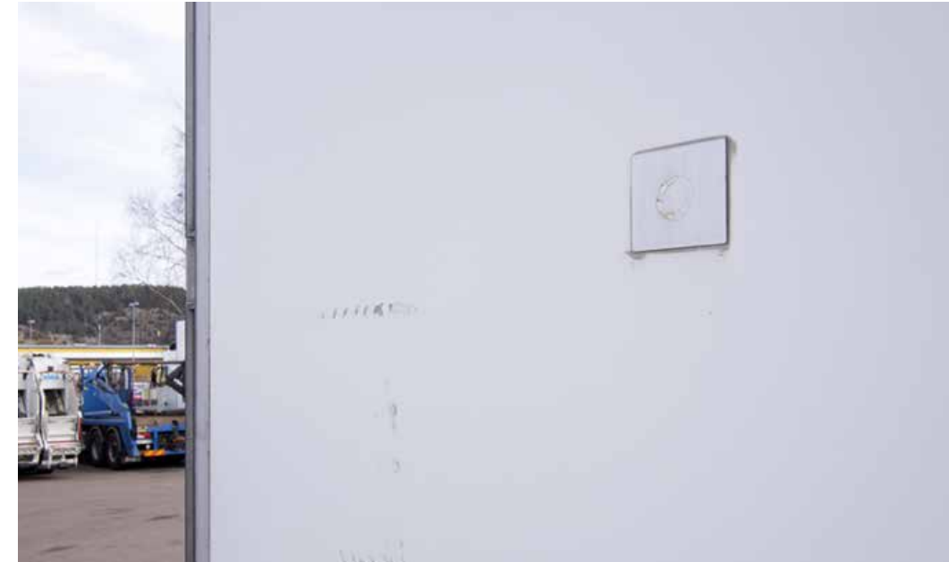
Pienet normaalista käytöstä johtuvat naarmut ja jäljet pinnoissa