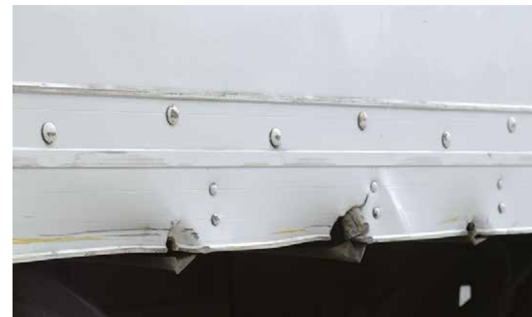
Vääntynyt tai vaurioitunut korirakenne