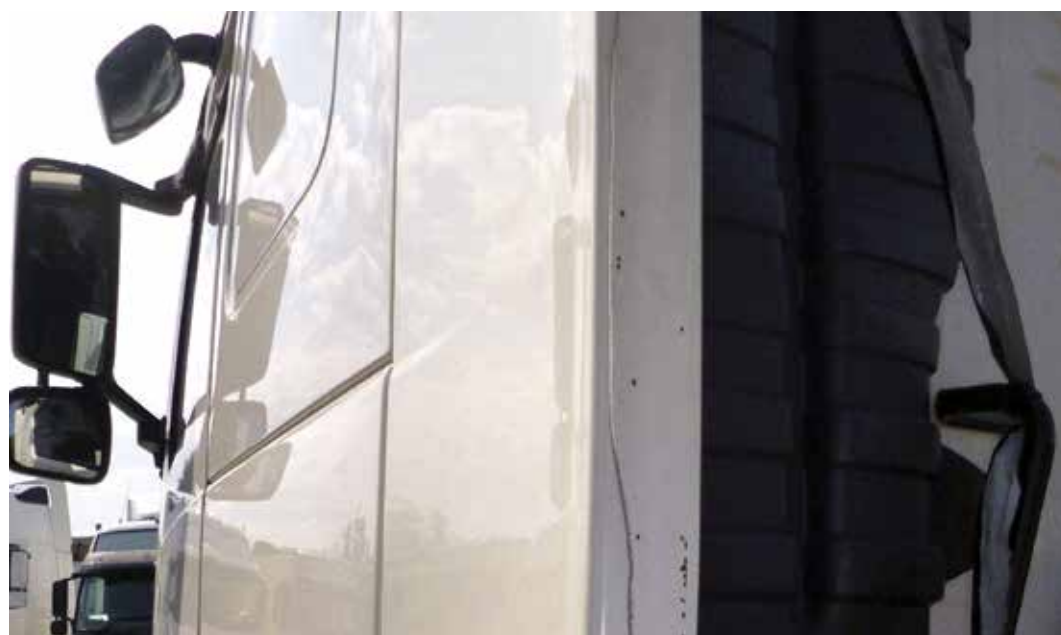
Halkeamat ja vauriot ilmanohjaimissa