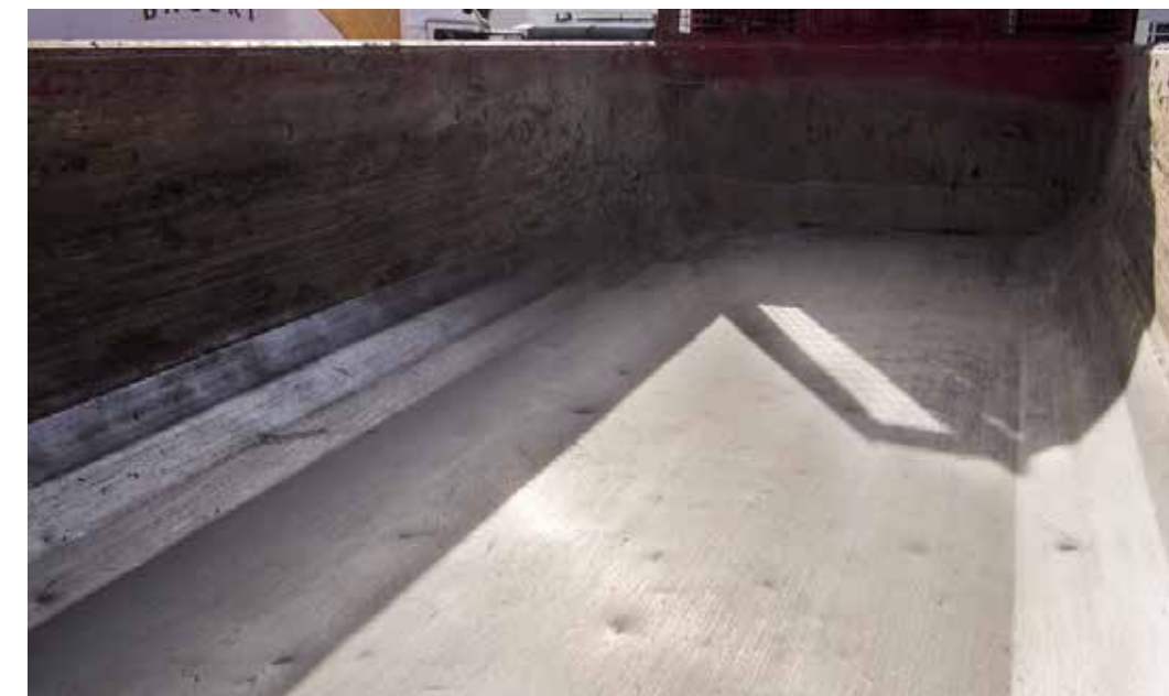
Puhdas ja ehjä kuormatila ajomäärän mukaisessa normaalissa kulumista vastaavassa kunnossa