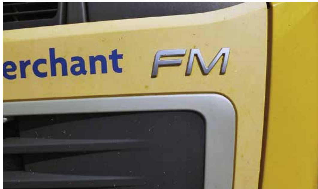
Huomattavat värierot, jotka johtuvat vääristä väreistä tai olemassa olevan maalauksen haalistumisesta.