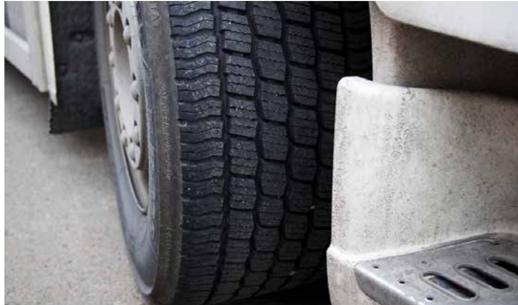
Normaalista käytöstä seuranneet vanteiden ja mutterikehien pienet vauriot