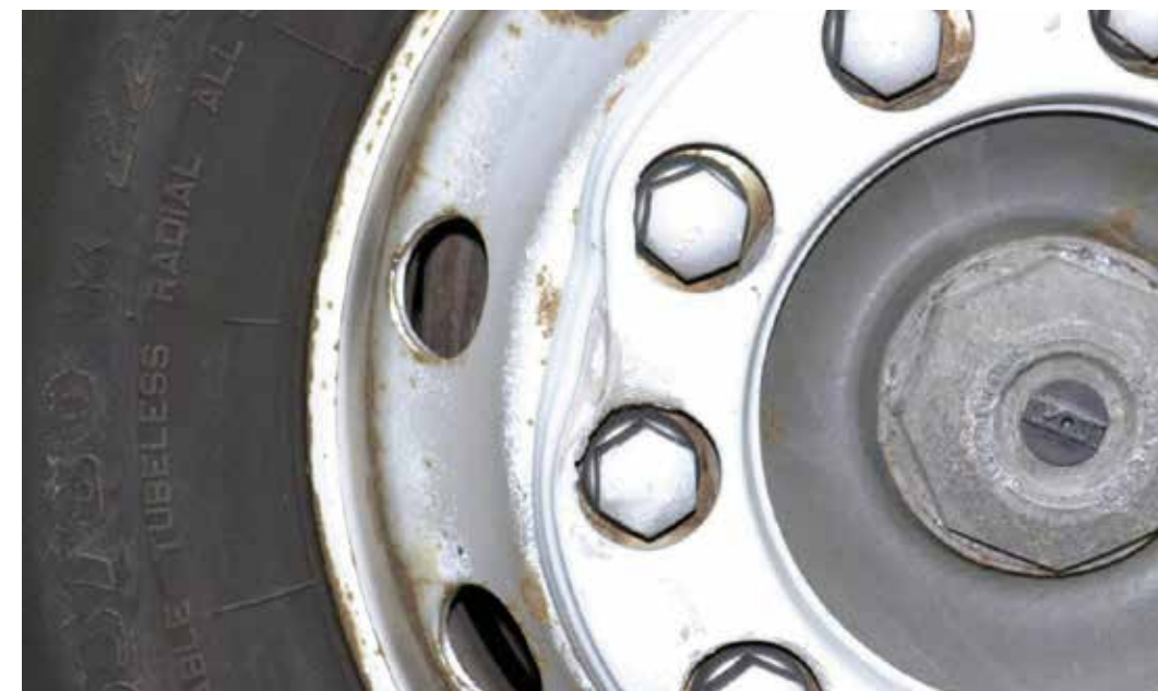
Iskujen ja kiinniajon aiheuttamat isot vauriot vanteissa ja mutterikehissä