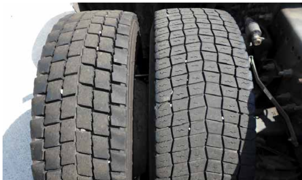
Epätasaisesti kuluneet renkaat samalla akselilla