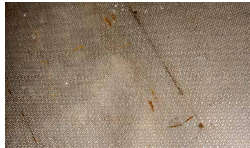
Lattian normaali kuluminen sekä normaaliin käyttöön liittyvät pienet vauriot