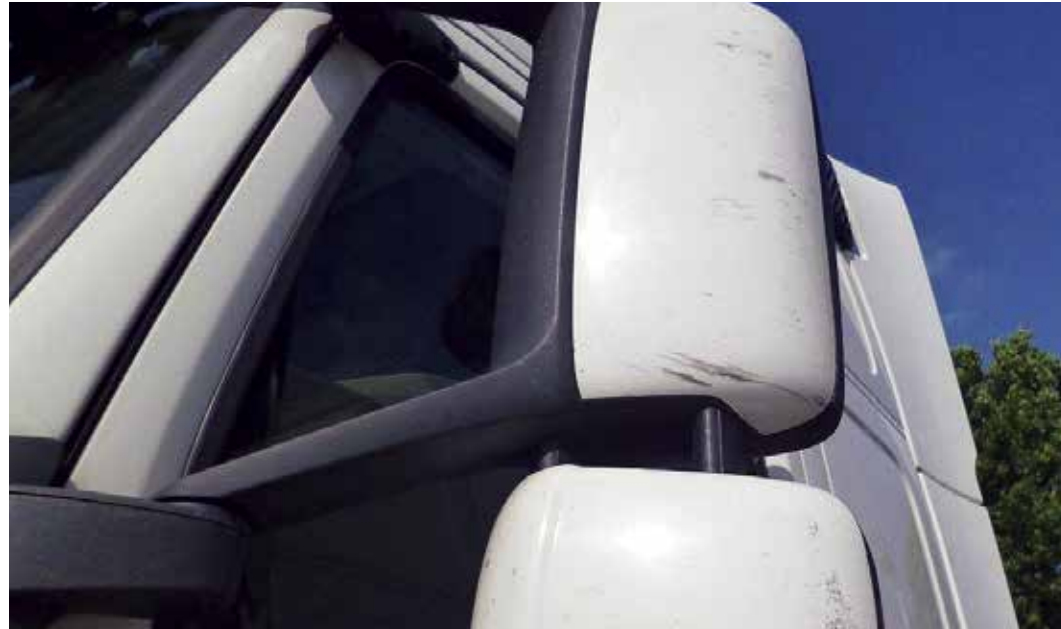
Pienuhköt naarmut ym. peilien taustoissa