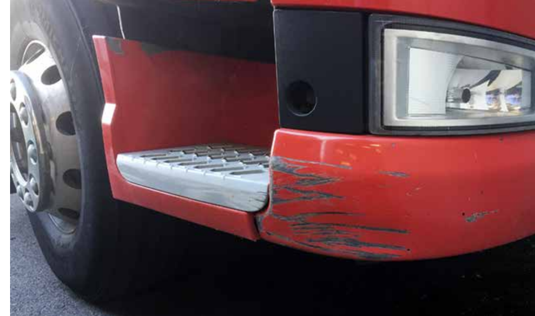
Naarmut ja kolhut, jotka ovat vaurioittaneet maalausta tai osan muotoa ja rakennetta