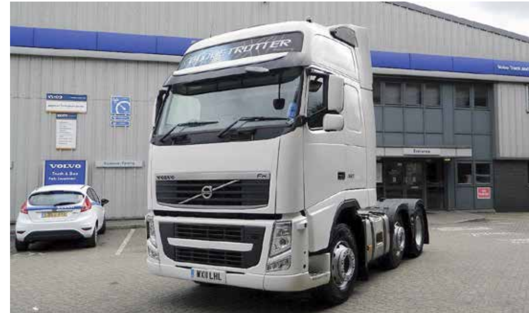
Itse kiinnitetyt teippaukset ja maalaukset tulee poistaa, niin että varjoja, liimajäämiä ei jää. Vauriot maalipinnassa tulee korjata ammattimaisesti