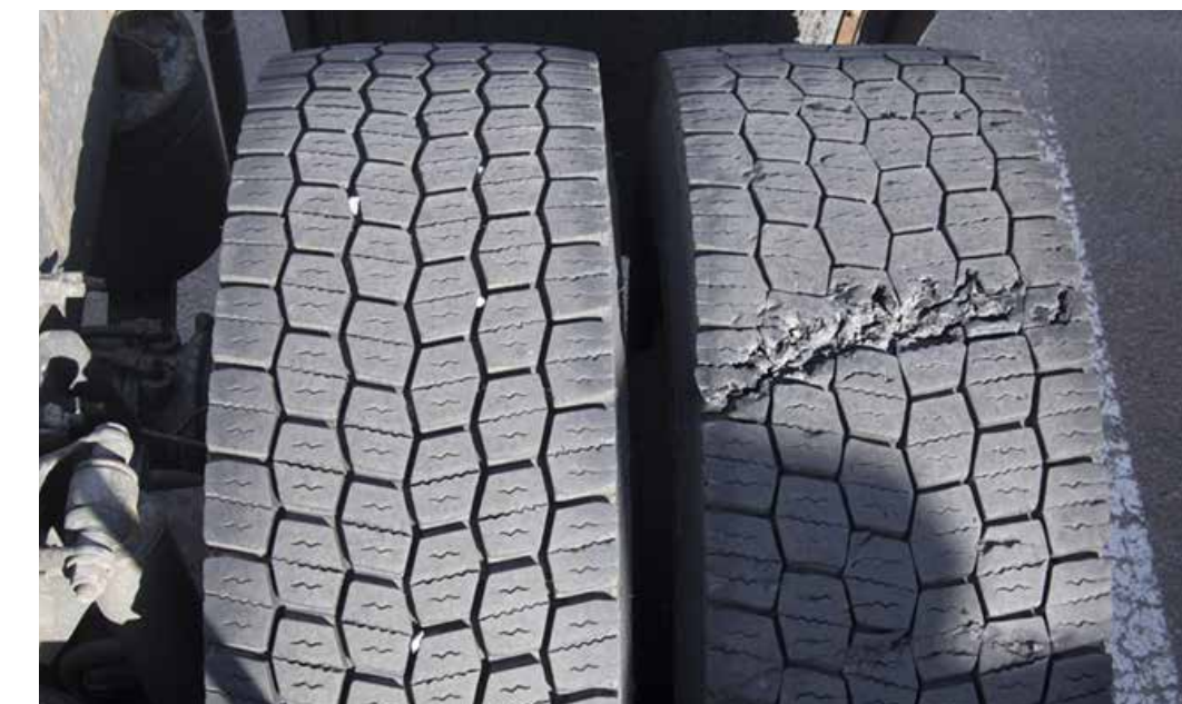
Isot vauriot renkaan kulutuspinnassa tai rungossa