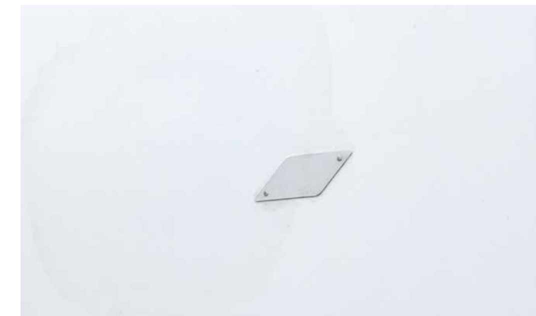
Vaurioiden korjaaminen kiinnittämällä levy, reikien paikkaaminen soveltumattomilla menetelmillä tai ylimaalaamalla