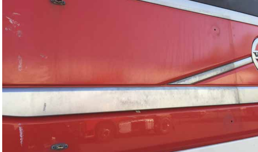
Naarmut, kolhut ja murtumat, jotka johtuvat ulkpuolisesta iskusta tai lisävarusteiden irrotuksesta