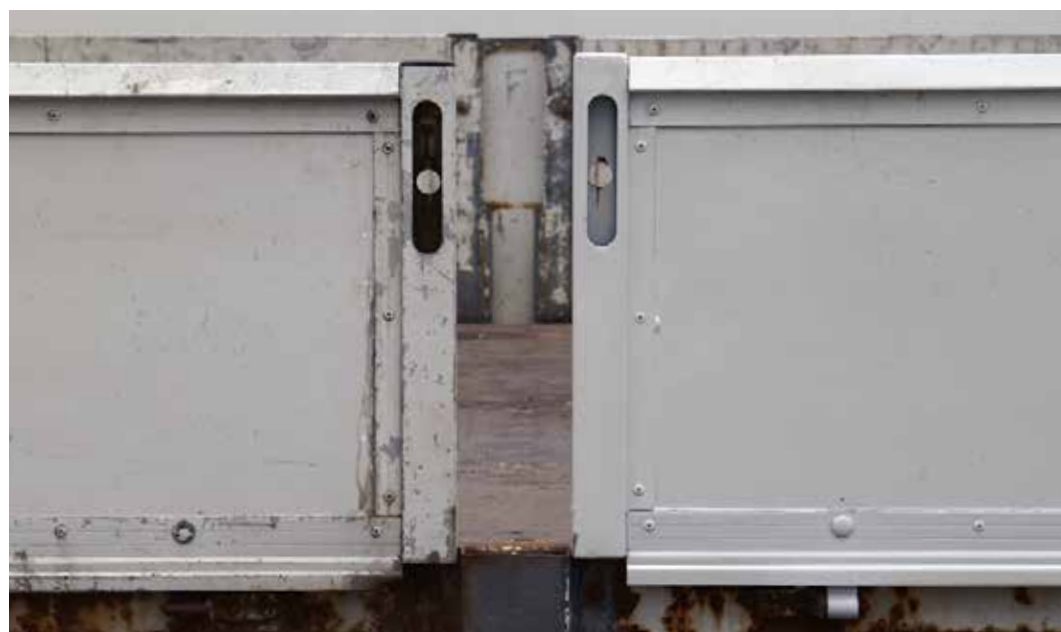
Puuttuvat keskipylyvät ja / tai lukitustapit ja saranat, jotka vaikuttavat pudotuspuolen tai takalaidan turvallisuuteen ja toimintaan