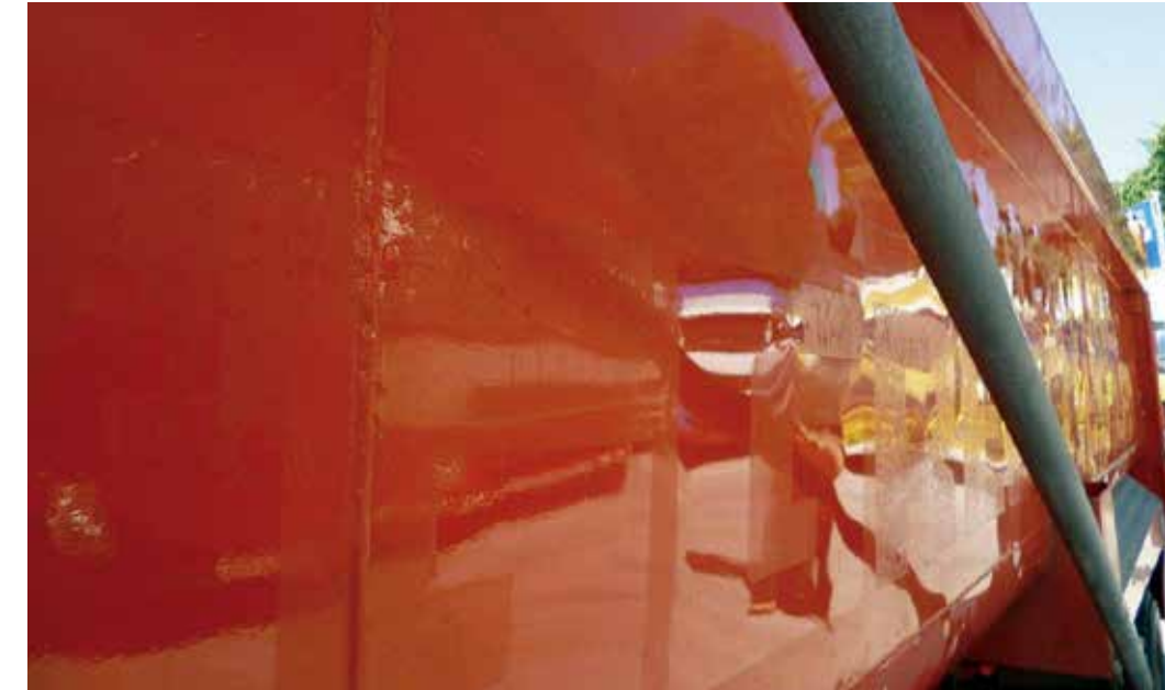
Normaalista käytöstä johtuvat pienehköt naarmut ja kolhut lavan pinnoissa