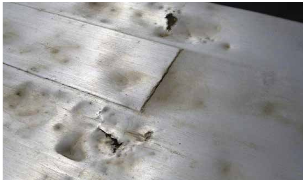
Lavan pinnoissa tai pohjassa olevat suuret ja syvät vauriot