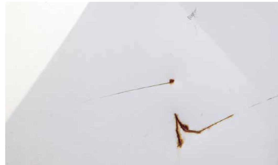
Syvät naarmut ja kolhut, jotka altistavat korin/lavan rakenteen vaurioitumiselle ja korroosiolle