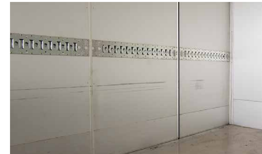
Puhdas ja ehjä korin sisätila ajomäärän mukaisessa normaalissa kulumista vastaavassa kunnossa