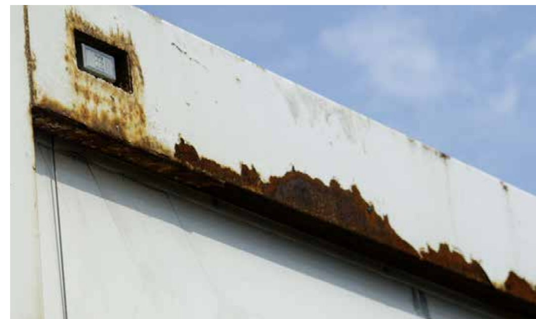
Merkittävät vauriot lavan pinnoissa ja rungossa, jotka ovat kuluttaneet maalipinnan puhki