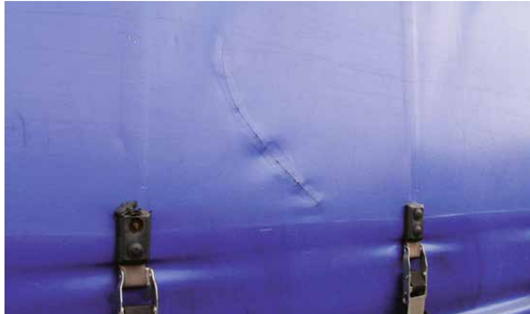
Pressujen ja lukitushihnojen vaurioiden ammattimaiset korjaukset