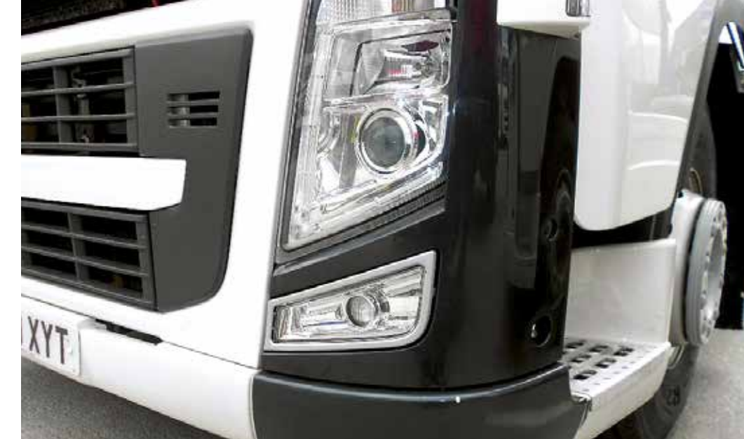
Sopimattomat paneelit tai vaihdetut osat, joita ei ole maalattu ajoneuvon värillä.