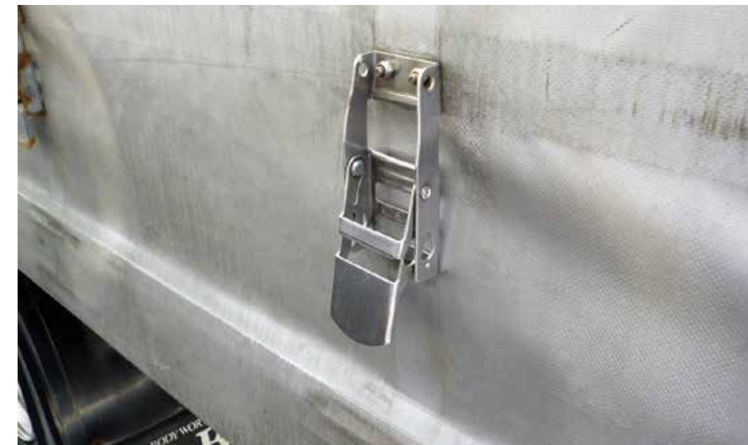
Yli kolme korjausta yhdelle verholle. Repeämät tai huonosti korjatut vauriot. Puuttuvat hihnat, rullat tai soljet