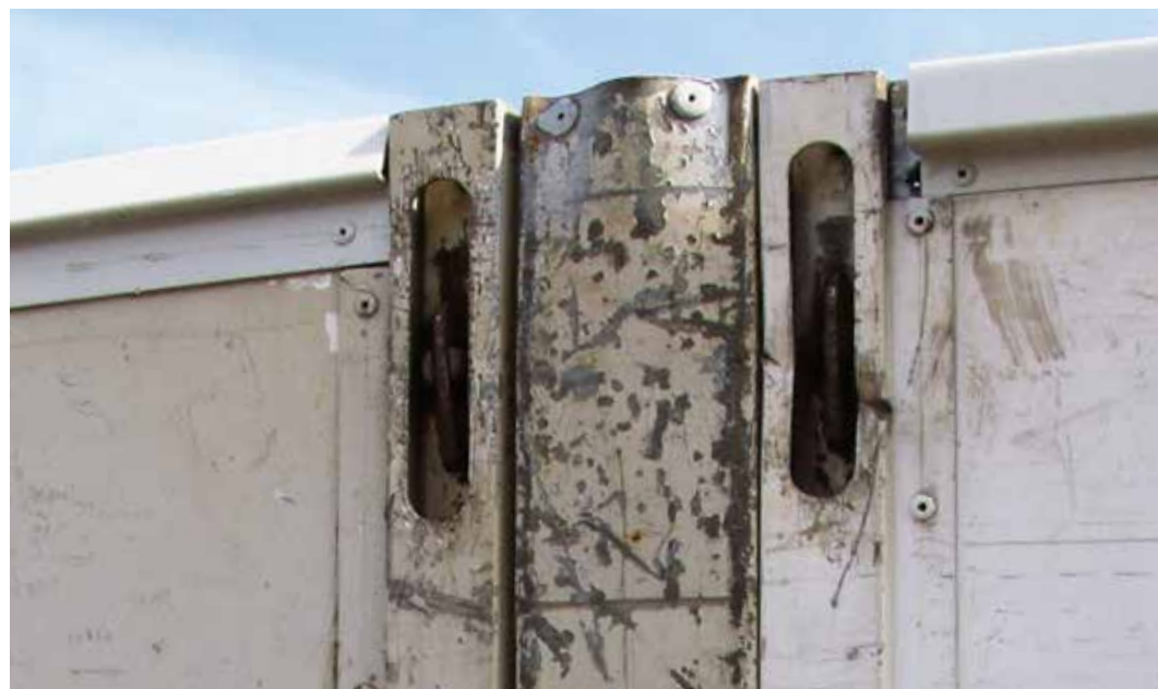
Lukitustappien ja saranoiden normaali kuluminen